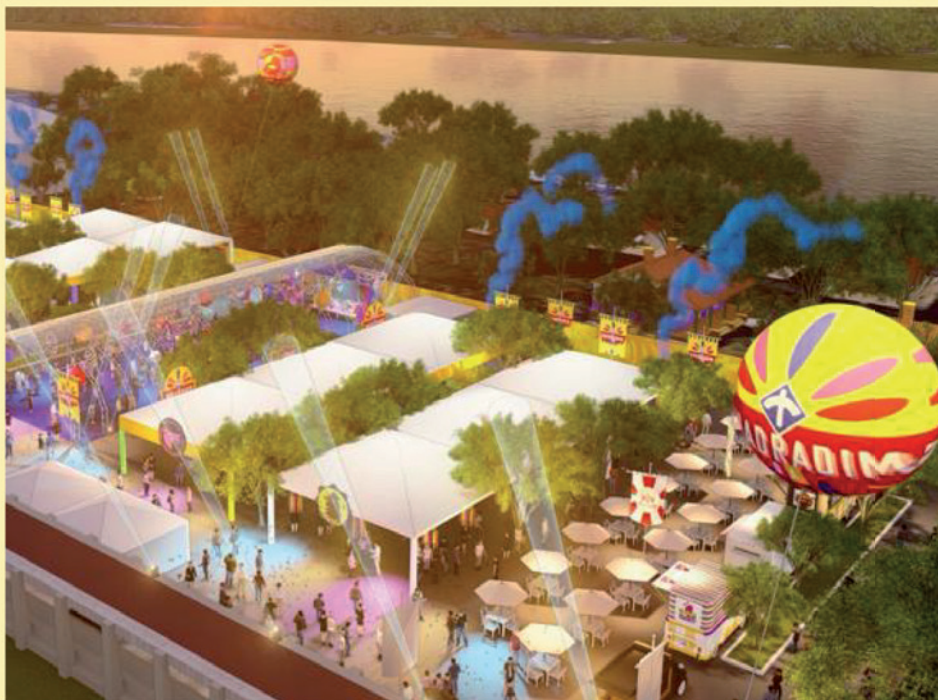
SE LIGA: Quadradim da folia 10,11 e 12.02