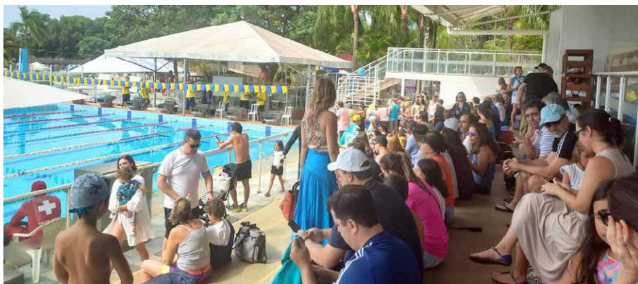
Cerca de 400 sócios e convidados acompanharam as atividades do Festival de Nataç o

No dia 30 de outubro aconteceu o 2 o dia de atividades do Festival de Nataç o de 2023. E assim como ocorreu com os pequenos atletas da modalidade, foi um momento de aprendizado, integraç o, alegria e, claro, de muitas medalhas. Ao todo, foram 117 inscritos da escolinha e 11 pequenos atletas do projeto Touca Estrela.