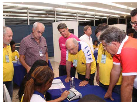
Os membros da Comissão Eleitoral e os candidatos acompanharam todo o processo de apuração dos votos