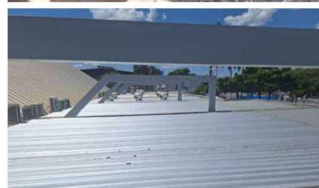
Conclusão da troca parcial das telhas do Iate Shopping