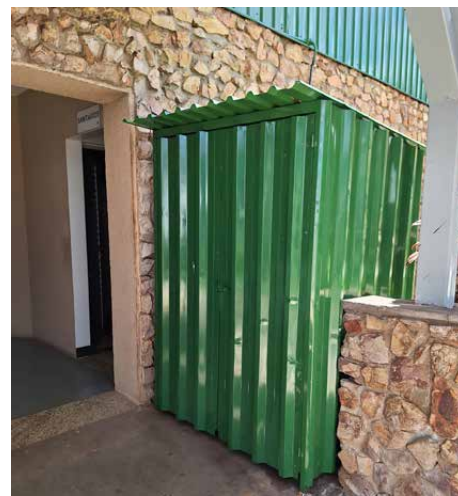
Conclusão do depósito de lixo ao lado do Bar dos Cunhados