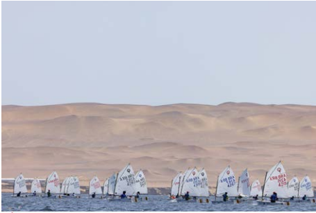
OPTIMIST2023 South American Championship Paracas, PERU

No período de 15 a 22 de abril, aconteceu o Campeonato Sul-Americano de Optimist, na cidade de Paracas, no Peru. A competição internacional foi finalizada com dez regatas disputadas em uma raia de 143 atletas. Os brasileiros superaram ventos fracos, médios e com forte intensidade durante a semana.