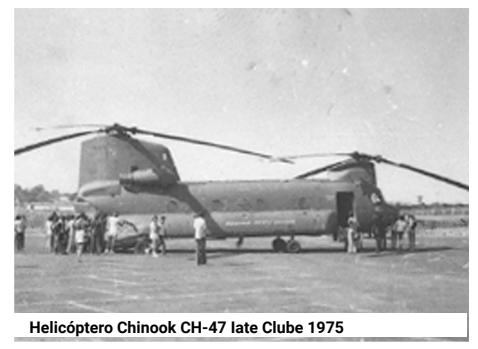
Helicóptero Chinook CH-47 Iate Clube 1975

Um dos grandes marcos na história do Clube nos primeiros 20 anos de história