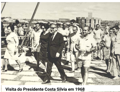
Visita do Presidente Costa Silva em 1968

A beleza do Iate encanta a todos que já tiveram a oportunidade de visitar o Clube. Além da natureza exuberante, com vasta flora típica do cerrado, o conjunto arquitetônico chama a atenção, com obras de renomados artistas brasileiros.