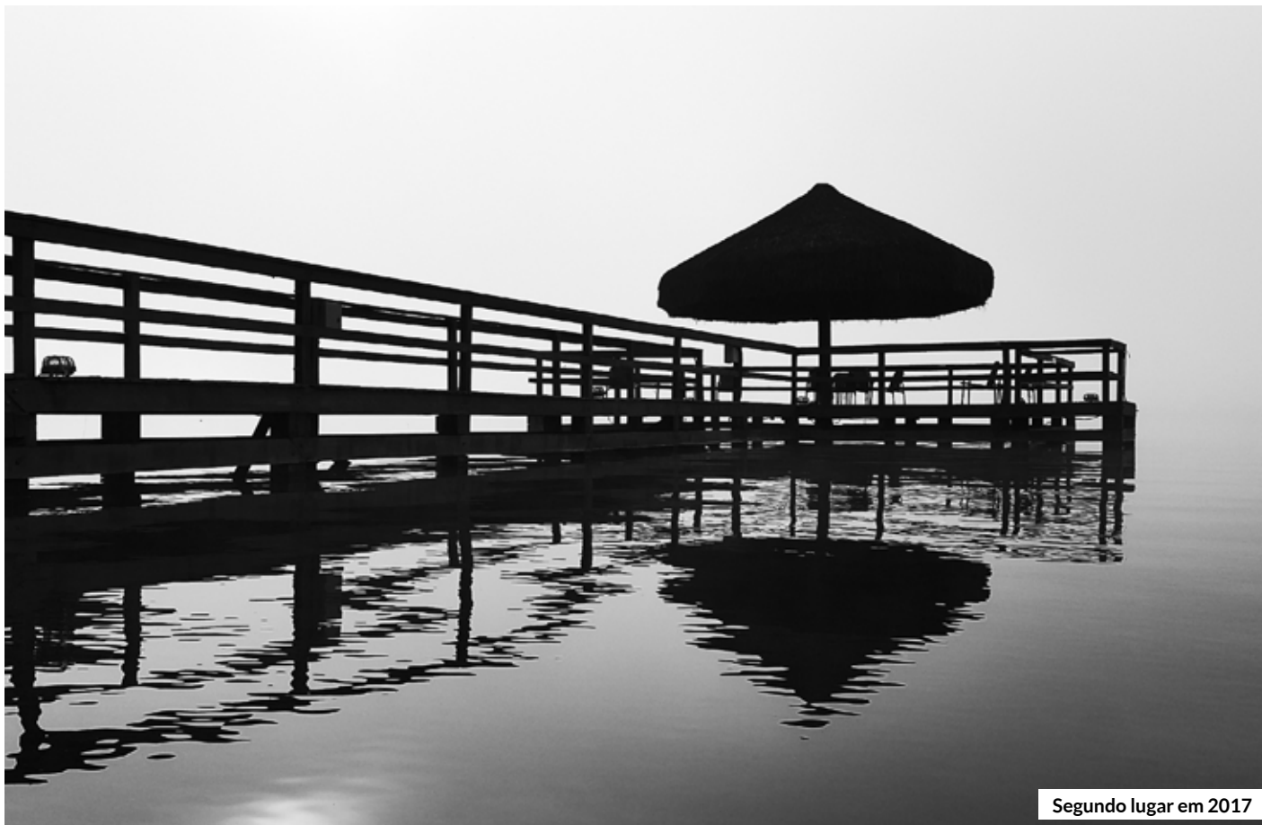
Segundo lugar em 2017

E m comemoração ao aniversário de 61 anos do Iate, a Diretoria Cultural vai promover uma nova edição do seu tradicional Concurso de Fotografia. A ação tem como objetivo convidar os Associados a dividirem seu olhar particular sobre o Clube e suas atividades.